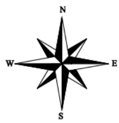
Схема геодезических построений